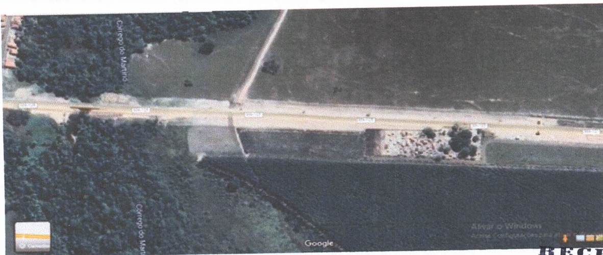
IMAGEM DE SATÉLITE DO CEMITÉRIO MUNICIPAL 2022

RECEBIDO Em: 10/01/2023 Câmara Municipal de Vereadores VILA NOVA DOS MARTÍRIOS - MA